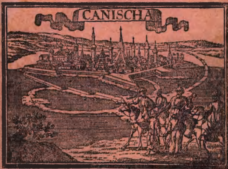
Nagykanizsa a török időkben