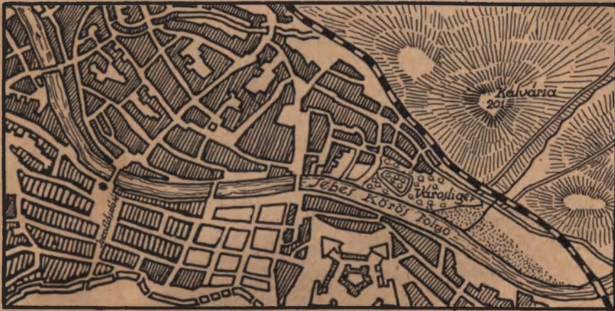
Szent László útja.