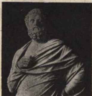
Sophokles. (Róma, Laterán.)

Perikles a spártaiakkal szemben Kimon békülékeny politikáját követte. Időt akart nyerni, hogy Athén kellőképpen felkészülhessen a kikerülhetetlen küzdelemre. Erre a célra, valamint Athén szépítésére a delosi szövetség pénztárát használta fel, amelyet Athénbe helyezett át. Mindenekelőtt kiépítette az ú. n. hosszú falakat , amelyek a város tengeri kikötőjéig, a Piraeusig húzódtak s ezzel elérte azt, hogy Athént szárazföldi ostromzárral nem lehetett kiéheztetni. Athén hatalmának alapjává a hajóhadat tette, amelyet úgy megnövelt, hogy a görög államok együttesen sem versenyezhettek vele.